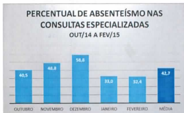
Gráfico 02: Percentual de absenteísmo nas consultas odontológicas especializadas por Centro de Especialidade Odontológica do município de Porto Alegre.